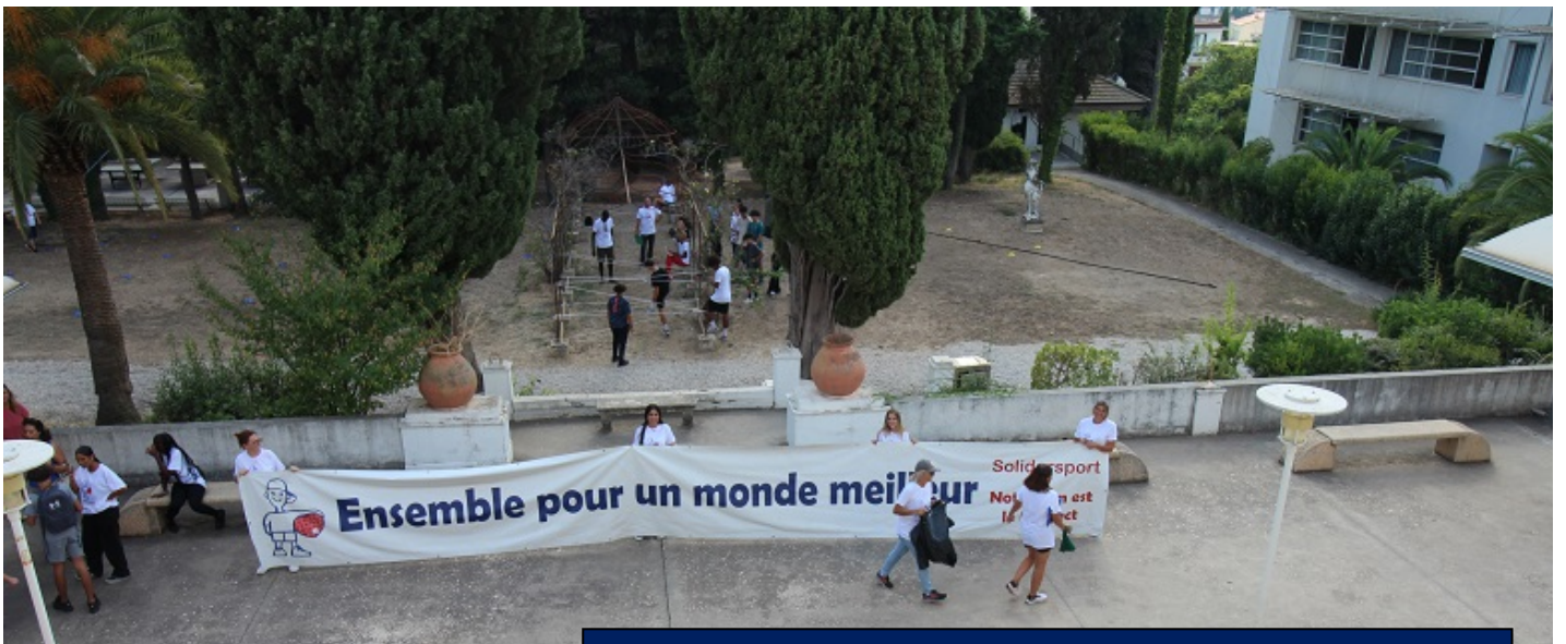
Dans le magnifique cadre du lycée " Les Côteaux " ... la mobilisation des professeurs