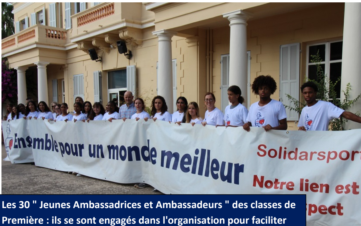
Les 30 " Jeunes Ambassadrices et Ambassadeurs " des classes de Première : ils se sont engagés dans l'organisation pour faciliter l'arrivée de leurs jeunes camarades.

Car avec le lancement du " Challenge des Jeunes Ambassadrices et des Jeunes Ambassadeurs Solidarsport" .... le lycée Les Côteaux s'est installé en pôle position et fait figure de "Fer de lance".